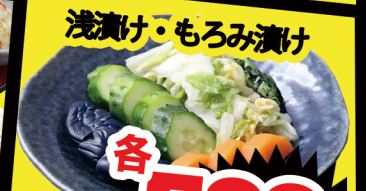
浅漬け・もろみ漬け