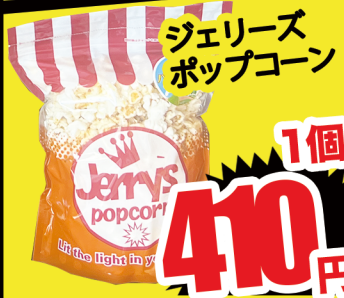
ジェリーズ ポップコーン