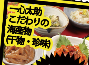
一心太助 こだわりの 海産物 (干物・珍味)