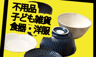
不用品 子ども雑貨 食器・洋服