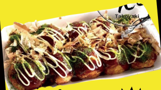
たこ焼き 塩・ソース